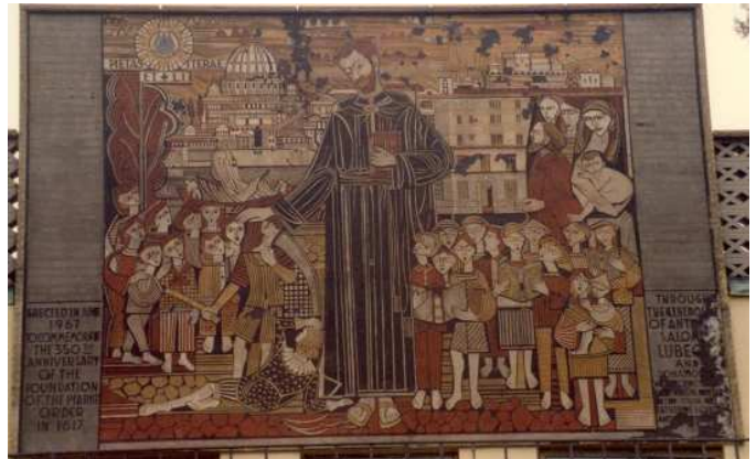
El Mural de Calasanz cuando estaba en nuestra casa de Derby

Los Escolapios habían construido su capilla en la casa Graycliff de tal modo que la línea de la azotea, su famoso perfil, había sido “mutilada”. Wright se calmó cuando le explicaron que lo que aquellos sacerdotes habían hecho era con un objetivo espiritual, y que lo cierto era que su llegada a Graycliff había impedido al lugar caerse completamente arruinado, o ser demolido. Cambiado, sí. Convertido de casa de verano en una residencia fija, sí. Conserva- do, imperfectamente, sí, pero conservado sin embargo. Cuando, en 1999, 40 años después de la muerte de Wright, un grupo de defensores arquitectónicos com- praron la casa Graycliff a los Escolapios, los preservacionistas decidieron quitar la capilla de los Escolapios, y demoler el dormito- rio. El objetivo de la sociedad Graycliff, naturalmente, era de- volver la casa al diseño original de Wright. Pero la de Wright no era la única obra de arte en el lugar.