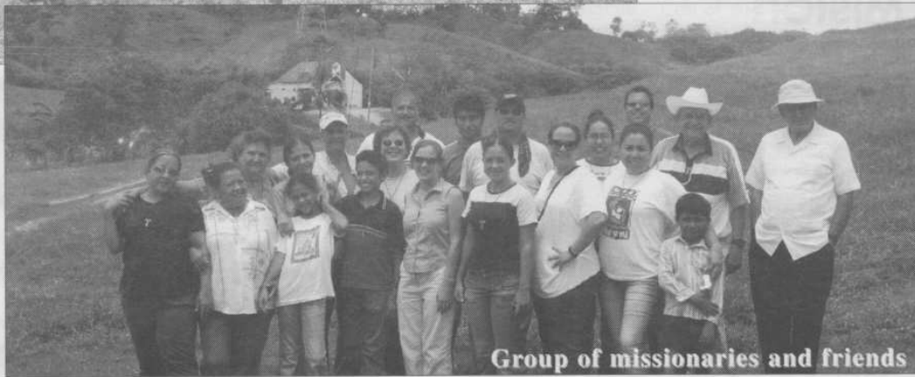
Group of missionaries and friends